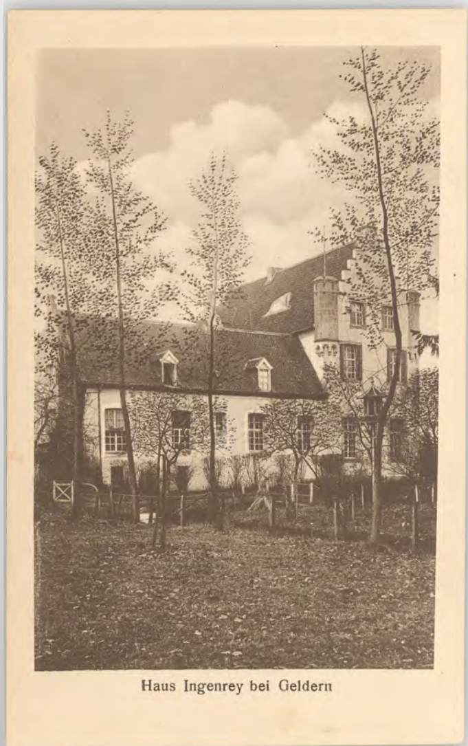
Haus Ingenrey bei Geldern