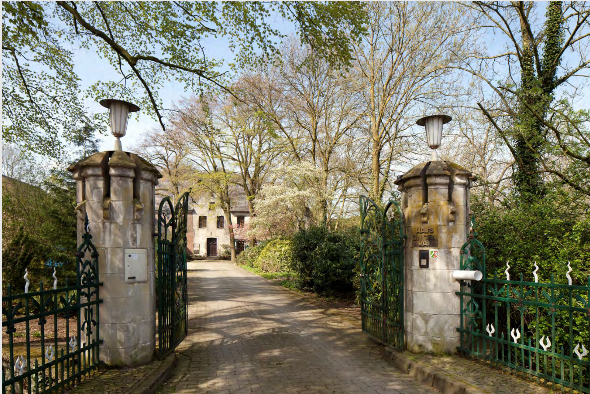
Haus Ingenray, 2018